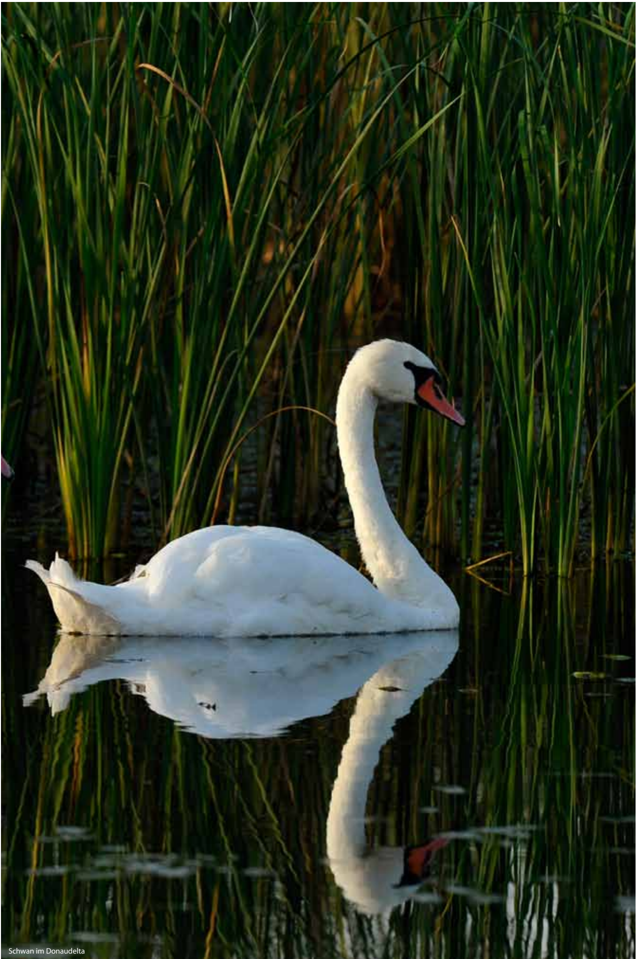
Schwan im Donaudelta