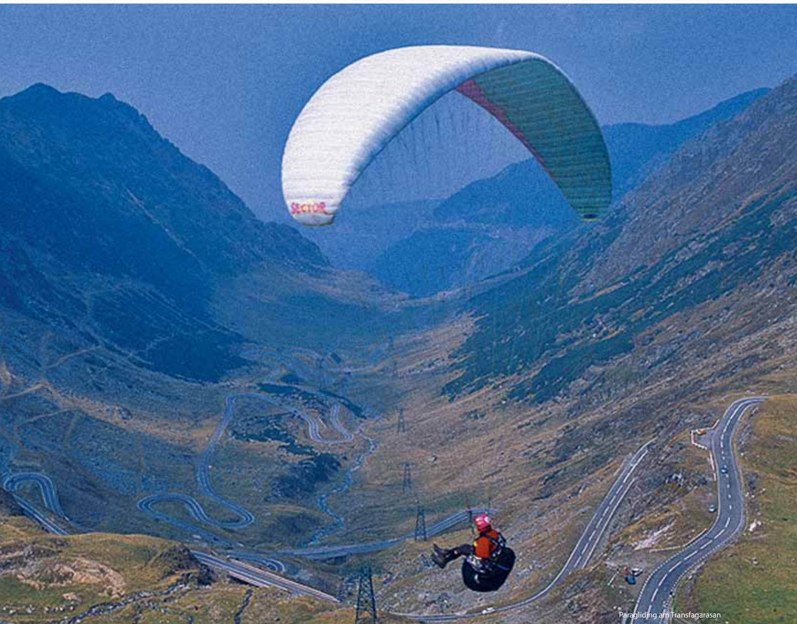
Paragliding am Transfagarasan

Das beeindruckende Donau-Tal beginnt Schritt für Schritt seine ganze Pracht zu zeigen. Der erste Kalksteinabschnitt heißt Stramtura Pescari – Alibeg und zeigt sich gleich mit steilen, bis zu 120 m hohen Hängen aus Jurakalkstein und Kreideformationen. Nach dem sie die Cozla-Felsen erreicht und einen großen Bogen macht, erreicht die Donau den zweiten Kalksteinabschnitt des Defilees und wird immer stärker vom Berggürtel umschlungen und eingeeengt. Ab Kilometer