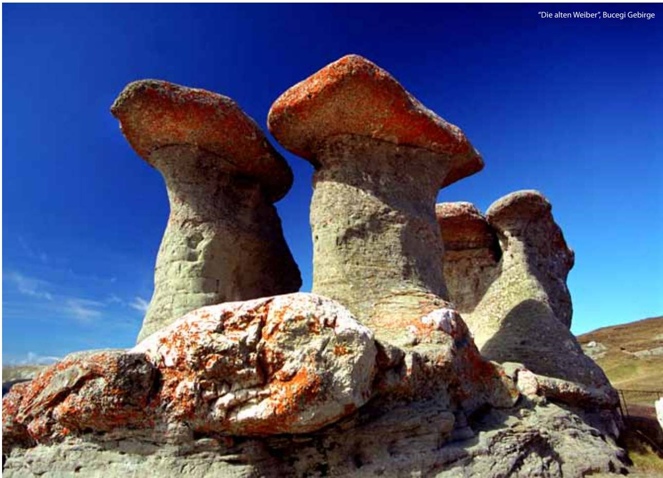
„Die alten Weiber“, Bucegi Gebirge

langen Weg durch Europa scheinbar froh, das Schwarze Meer erreicht zu haben und geht in drei Armen auseinander: Chilia, Sulina und Sfântu Gheorghe. So entsteht dieses einzigartige Feuchtgebiet Europas.