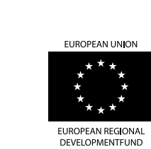
EUROPEAN UNION EUROPEAN REGIONAL DEVELOPMENT FUND

Name: Salica Batrana / De Oude Wilg Kategorie: k. A. Preis: ab 5 € Strom, Wasser, WC, Dusche Adresse: Prunduajust. 311, RD-557070 Öffnungsperiode: April – September Tiere erlaubt: Ja Tel.: +4001269.521.347 Handy: +4001723.186.343 E-Mail: de_oude_wilg@yahoo.com Web: www.campingdeoudevilg.nl Lageplan: E4 Lage: E68 Sibiu- Brașov, 45 km hinter Sibiu. Auffahrt Carta an der Nordseite der Strecke. Angebot: Strom, Wasser, Dusche, moderne Sanitäranlagen; Gut gepflegter Campingplatz, Gaststätte mit traditioneller Küche 38. Csnadoara / Sibiu Name: Ananas Kategorie: k. A. Preis: ab 5 € Adresse: Cimituluzest. 32, RD-555301 Öffnungsperiode: 15. Mai – 30. September Tiere erlaubt: Ja Tel.: +4001269.566.066 Handy: +4001741.746.689 E-Mail: m.beneoer@ananas70.de Web: www.ananas70.de Lageplan: E4 Lage: Von Sibiu Richtung Paltnitz, dann Richtung Csnadoa. Aufahrt Csnadoara. Ca. 10 km von Sibiu, schlechte Zufahrt Strom, Wasser (Warmwasser ist begrenzt), Dusche, WC, Servikerstation für Wohnmöble; einfacher Platz, am Hang